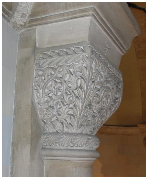
Detalle de un capitel de la Iglesia de San Jorge de Alcoy

3/ En el interior de las iglesias bizantinas suelen abundar los capiteles de configuración general tronco piramidal y con decoración zoomorfa o vegetal de carácter intrincado, con diminutas hendiduras labradas en piedra; como recordando un avispero. En el interior de la Iglesia de San Jorge de Alcoy existen esas tipologías de capiteles, muy semejantes a los de Santa Sofía de Constantinopla.