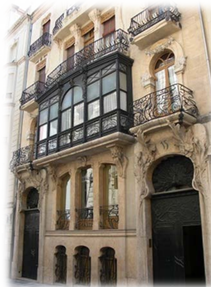
Casa del Pavo

Organiza: Departamento de Expresión Gráfica y Cartografía de la Universidad de Alicante