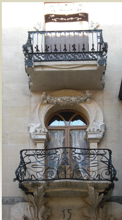
Casa del Pavo

Organiza: Departamento de Expresión Gráfica y Cartografía de la Universidad de Alicante