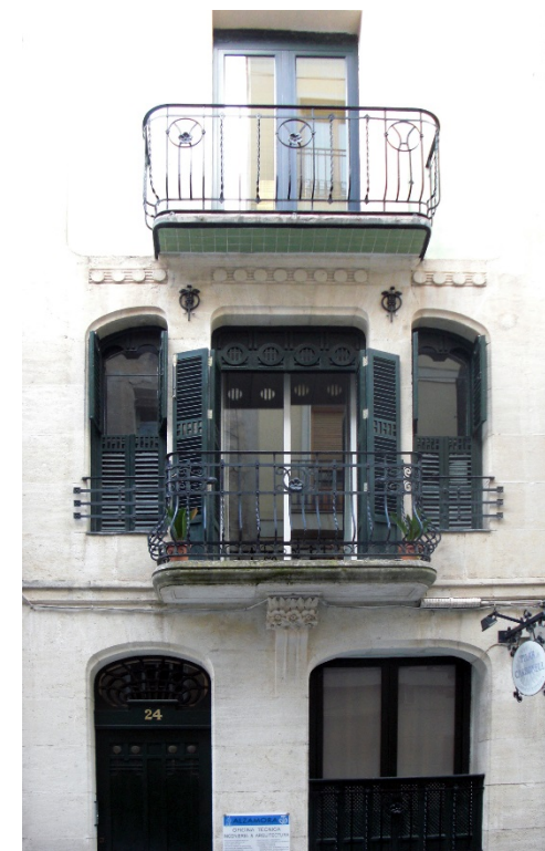
Casa de Timoteo Briet Montaud